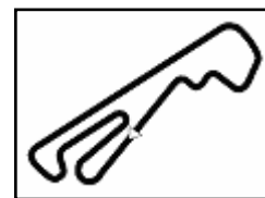
Autodr. Borzacchini 2.507 m