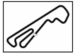
Autodr. Borzacchini 2.507 m